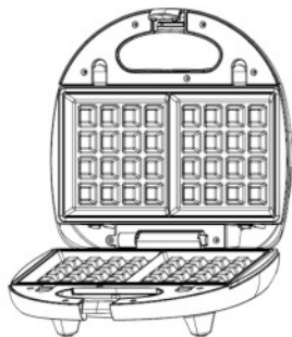
1 jeu de plaques à gaufres